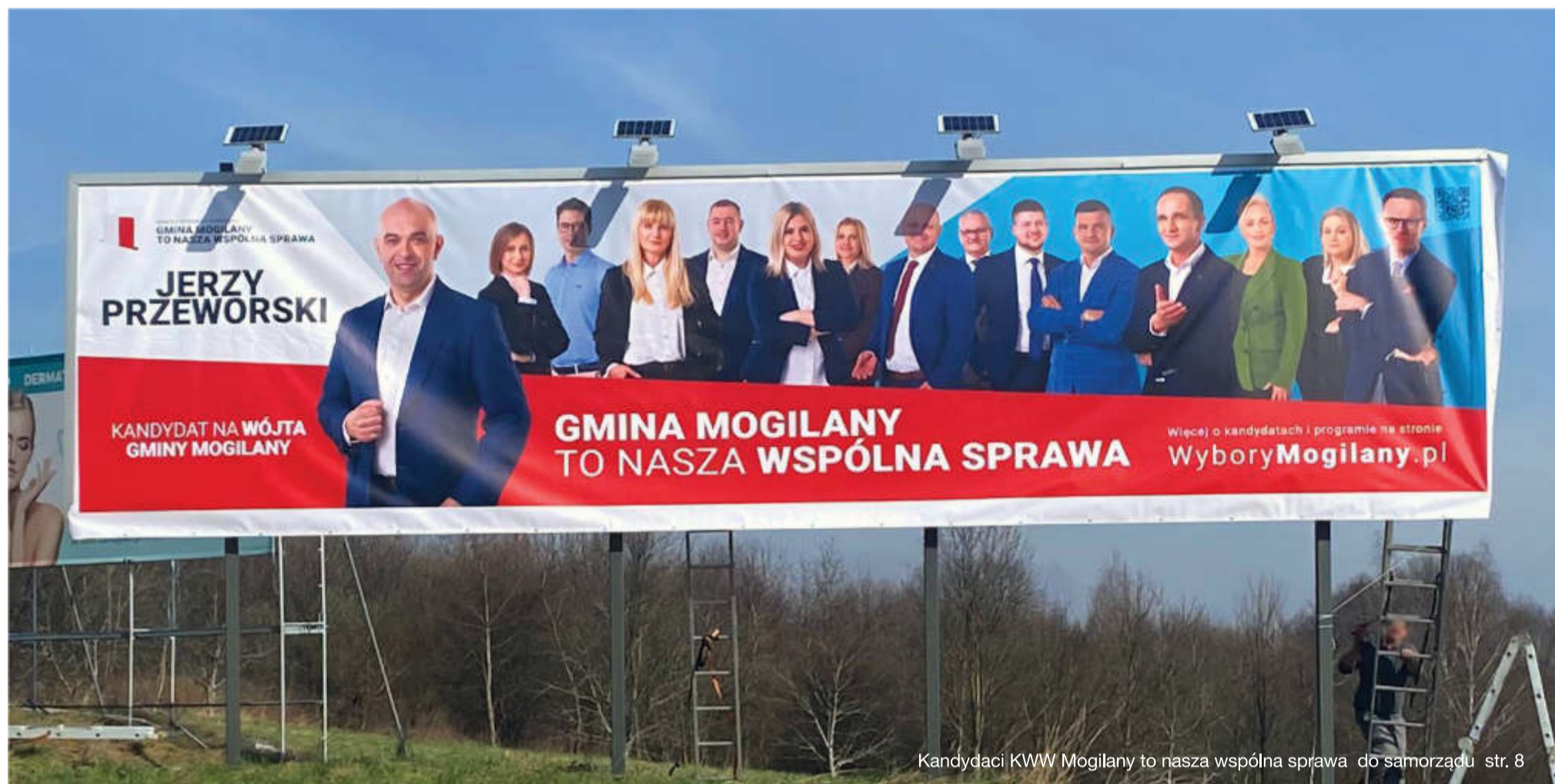
Kandydaci KWW Mogilany to nasza wspólna sprawa do samorządu str. 8

KOMITET WYBORCZY WYBORCÓW GMINA MOGILANY TO NASZA WSPÓLNA SPRAWA